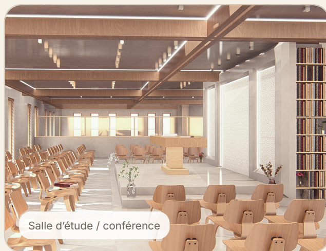
Salle d'étude / conférence

La convivialité y devient un outil de fidélisation, de rendez-vous et d'accompagnement.