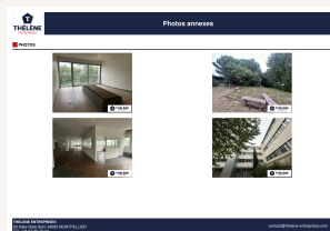
Extrait de la brochure propriétaire : intérieurs, extérieurs et abords.