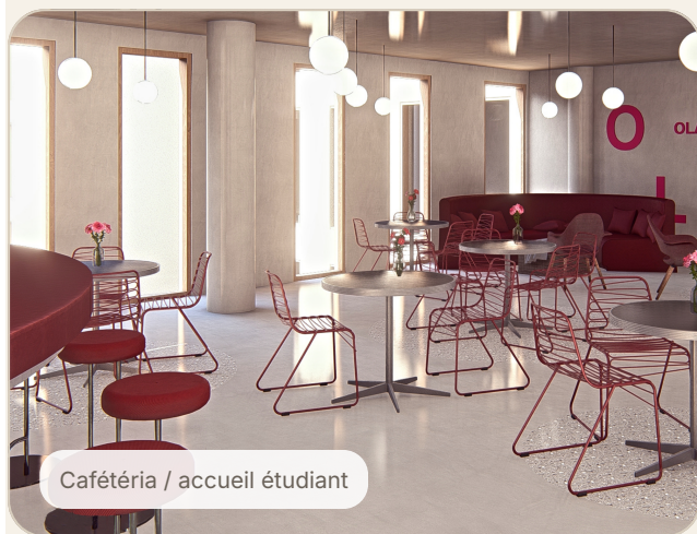
Cafétéria / accueil étudiant

La convivialité y devient un outil de fidélisation, de rendez-vous et d'accompagnement.