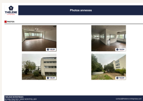
Extrait de la brochure propriétaire : vues du bâtiment actuel.

L'ensemble repéré avenue Saint-Lazare correspond à une opportunité concrète : un bâtiment indépendant d'environ 3 125 m 2 , situé sur un axe passant, à proximité immédiate des commerces, des pistes cyclables et des transports publics.